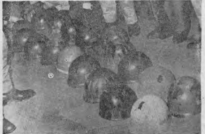
La foto de Meza nos deja ver cómo quedan los cascos protectores de los miembros de la Tercera Compañía de la Guardia Civil después del ataque que sufrieron por parte de los huelguistas que atacaron con piedras y palos, en los momentos nechos ocurridos el viernes pasado en Cartago.