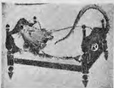
Con frecuencia, los animales van sorprendidos por la muerte en la posición característica de dormir.

Durante seis años, o sea de 1346 a 1352, la peste causó horribles estragos en Europa, sucumbiendo la mitad de la población de este continente por esta enfermedad contagiosa. Hoy día se sabe lo que nadie sospechaba entonces: Fueron las ratas que facilitaron la propagación de la peste; las pulgas de estos animales transmitieron los bacilos de la peste con sus picaduras al hombre.