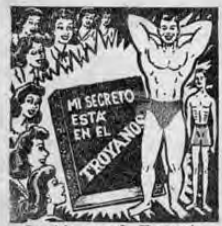
Contiguo al Emporio Ser piso Edif. "ORO"