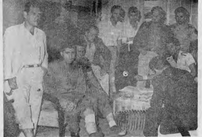
Alguno de los heridos pertenecientes a la 3ª Compañía de la Guardia Civil cuando eran entrevistados por uno de nuestros redactores. Obsérvese la seriedad del momento y la preocupación reflejada en sus rostros.

Según afirmaron sus otros compañeros, este joven fue herido por miembros de la Guardia Civil, aunque no concretaron si le hirieron las autoridades de Cartago o las de esta capital enviada esa noche a la Vieja Metrópoli. Le vimos muy delicado, pero el funcionario que le cuida advirtió que dentro de su grave condición ha experimentado una gran mejoría y puede decirse que —aunque su convalecencia será muy larga— sanará y podrá reintegrarse a su vida activa de trabajador.