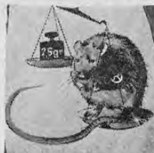
Como dosis letal para una rata bastan generalmente 2,5 g del cebo de Racumin 57 ingeridos, en 5 días consecutivos.

El heno de pipirigallo había sido infestado intensamente de ciertos hongos de moho, los que habían transformado la sustancia aromática natural por un proceso químico en hidroxicumarina o dicumarol, que resulta