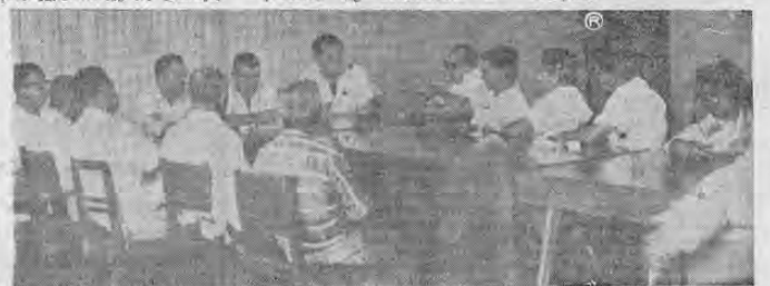
Aspecto parcial de los asistentes a la reunión.

Los agricultores, al término de la reunión se manifestaron sumamente complacidos con la nueva actitud que notas de parte del Consejo, relativa a un mayor contacto personal entre sus más altos esferas y los sectores productores. Esta actitud, —comentaron—, sólo beneficios podrá traer a los agricultores costarricenses. Por otra parte estuvieron de acuerdo concretamente en la necesidad de que el Consejo amplie la capacidad de su piladora de arroz en Barranca, proyecto al cual se han opuesto algunos propietarios de piladoras que sienten sus particulares intereses afectados con esta plan.